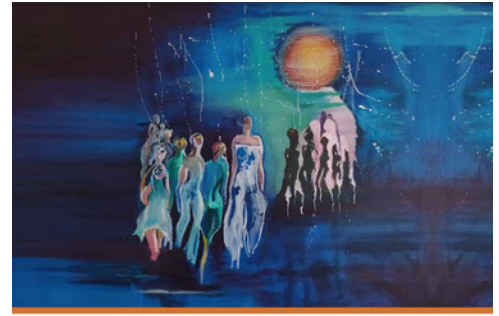
III Informe Regional del Sistema FLACSO

El III Informe Regional de la FLACSO sobre el tema de Género es el resultado de un proceso colaborativo entre las Unidades Académicas de la FLACSO. Sus capítulos se proponen identificar cuáles son las principales problemáticas en cada país en materia de igualdad en el comienzo del siglo XXI y ponerlas en diálogo con los aportes que se vienen realizando desde la comunidad académica de FLACSO.